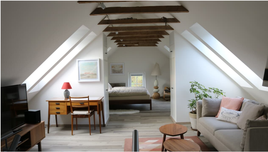
Gut Steineshof in Mettmann