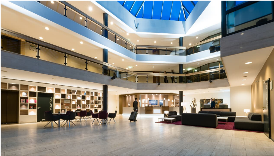
Lobby des Best Western Plus Parkhotels in Velbert