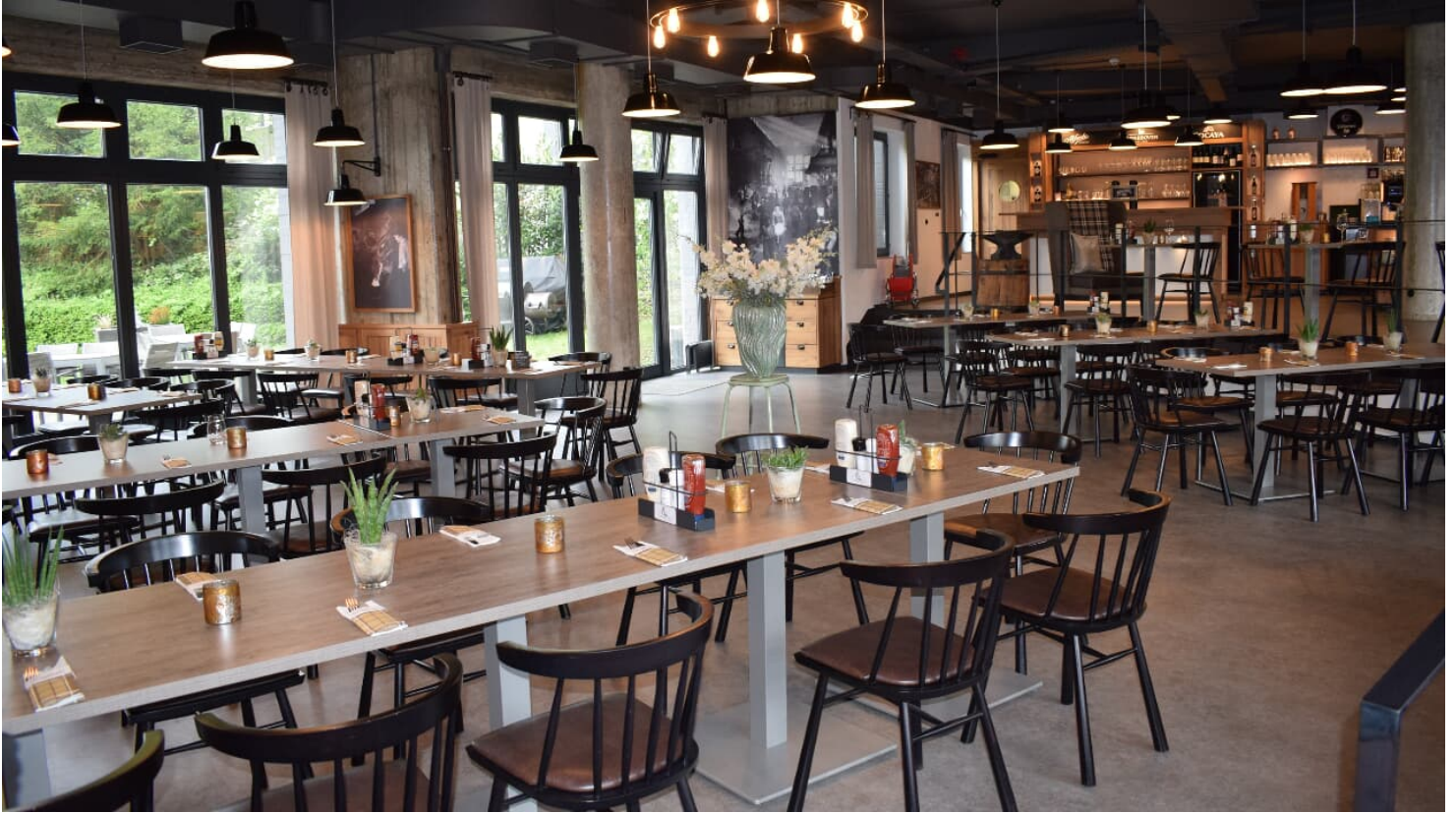
Restaurant Zur Gießerei im Best Western plus Parkhotel Velbert