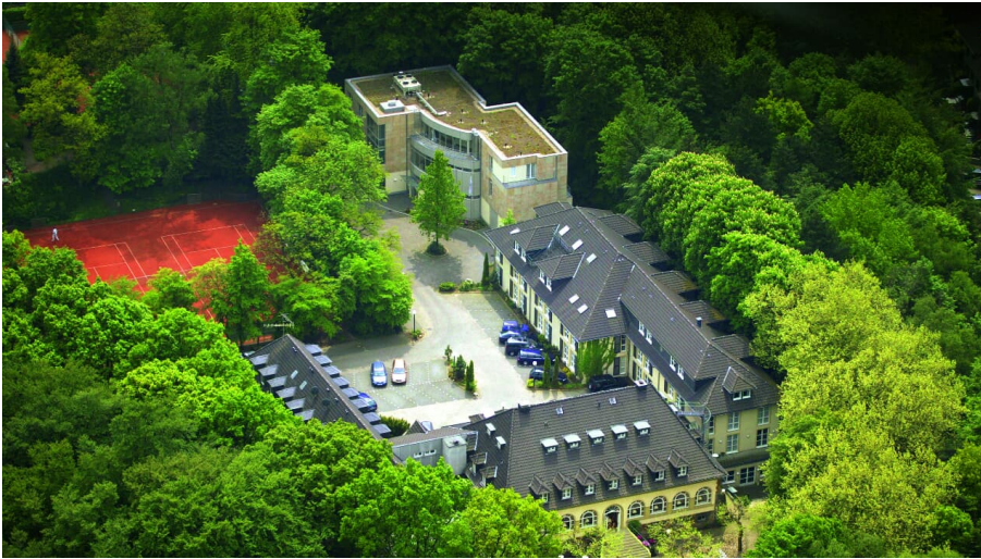
Waldhotel Heiligenhaus