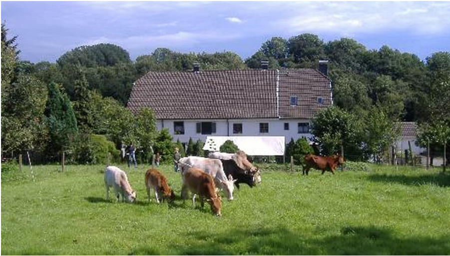
Gut Halfeshof in Mettmann