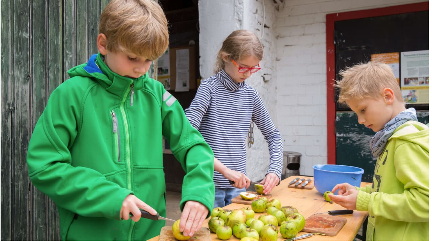
Kinder-Aktion auf Gut Halfeshof in Mettmann