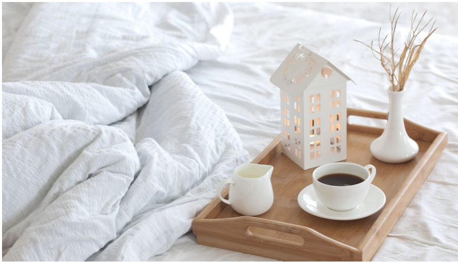
Musterfoto Übernachtung - © Alena Ozerova (Symbolbild), Alena Ozerova (AdobeStock_63545069)