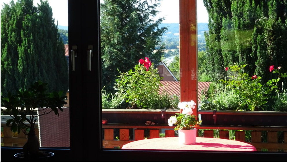
Aussicht Ferienwohnung Jakobs