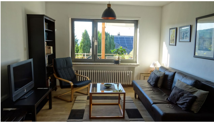
Ferienwohnung Jakobs Wohnzimmer