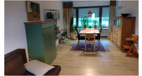
Wohnbereich Ferienwohnung Jakobs