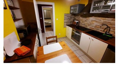
Küche Ferienwohnung Jakobs