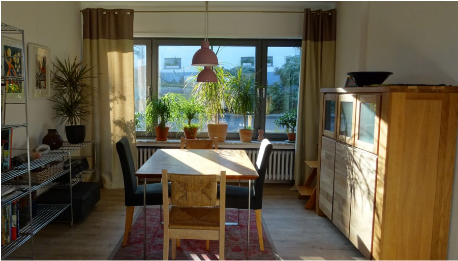
Ferienwohnung Jakobs Essbereich