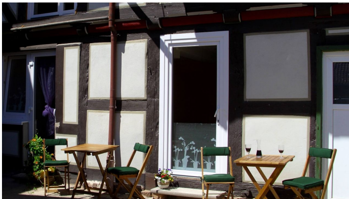
Terrasse Liederhof Hemeln