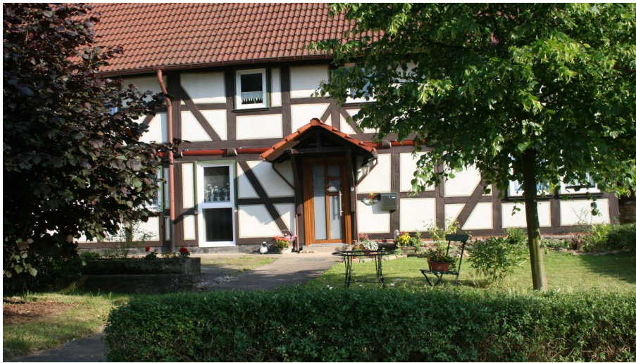
Liederhof Hemeln