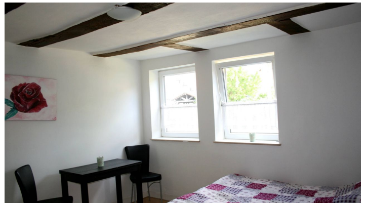
Zimmer Liederhof Hemeln