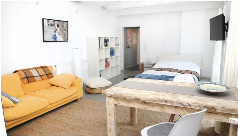
Ferienwohnung Sieveking u. Grünert