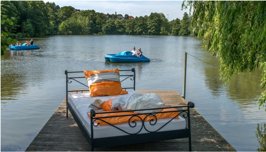
Übernachten in Bad Wünnenberg | Paderborner Land - - info@paderborner-land.de