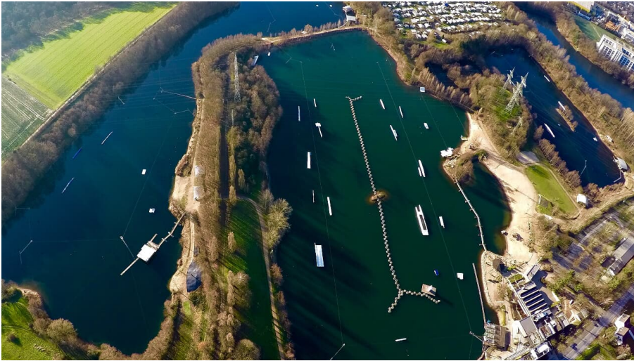
Anlage Wasserski-Langenfeld von oben mitsamt Campingplatz