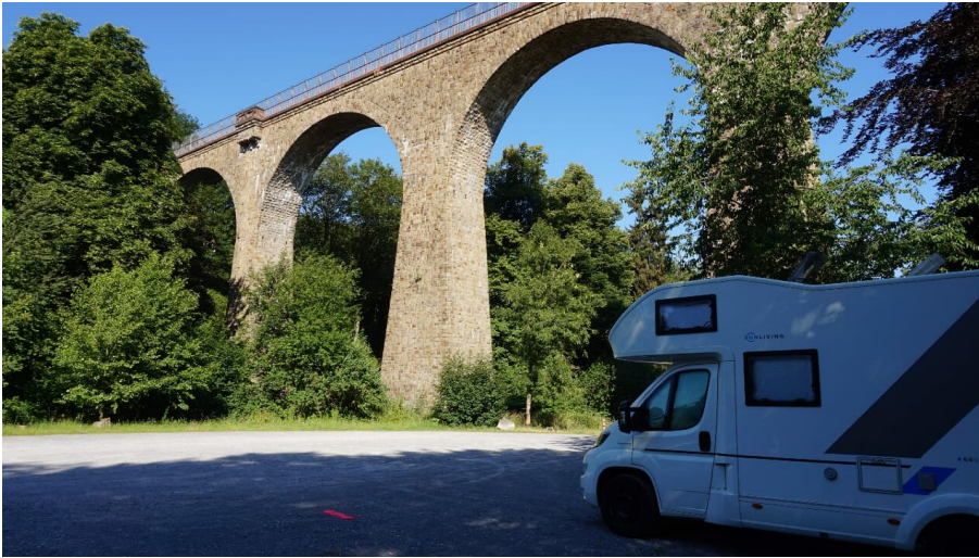
Wohnmobilstellplatz Saubrücke in Velbert