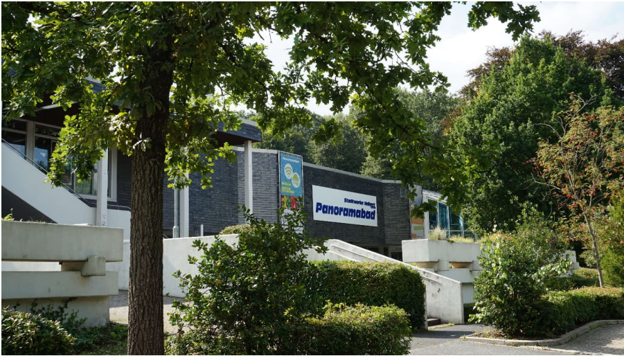
Wohnmobilstellplatz am Panoramabad in Velbert - © Stadtmarketing Velbert