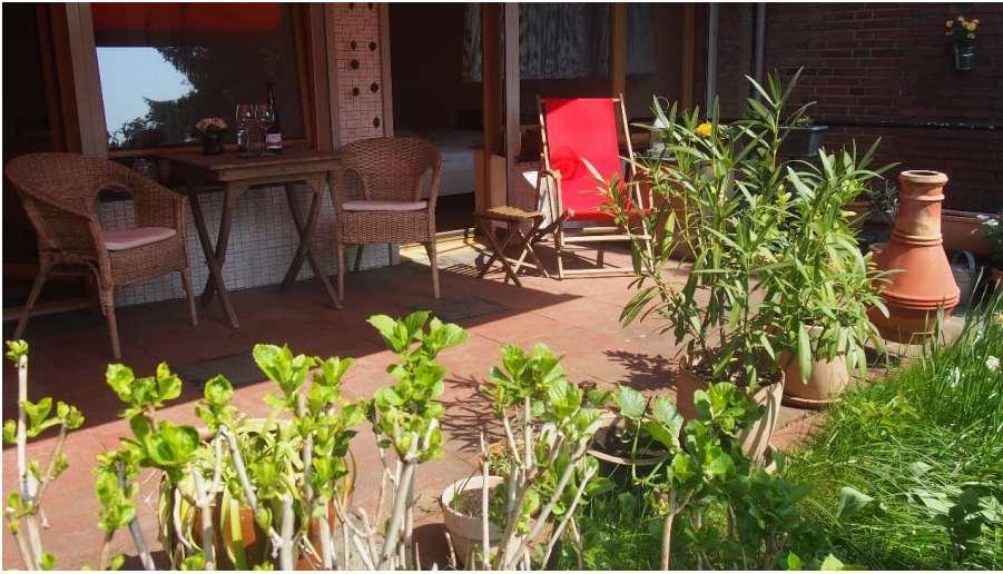
Ferienwohnung Neanderstop in Erkrath - © Alexandra Dietz, Wolfgang Stolte