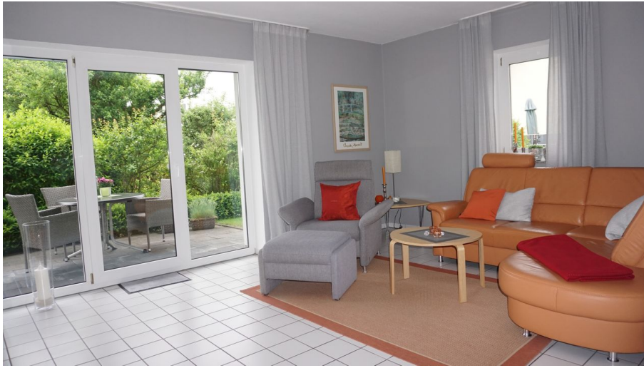
Ferienwohnungen Markus | Bad Lippspringe