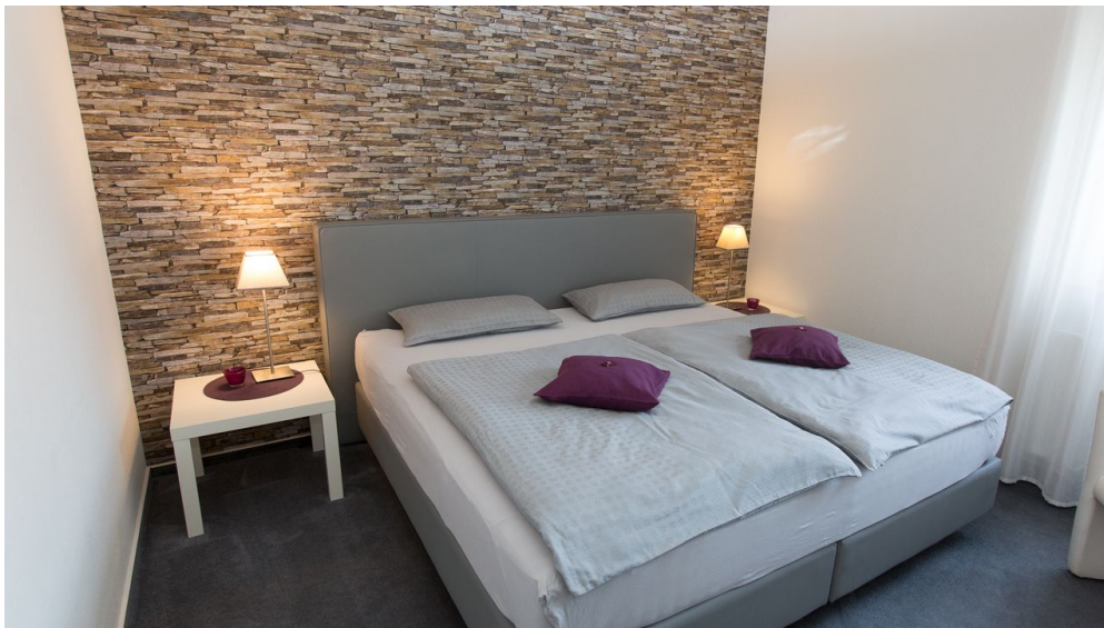
Ferienwohnungen Markus | Bad Lippspringe

Der nächste Bahnhof befindet sich in Paderborn.