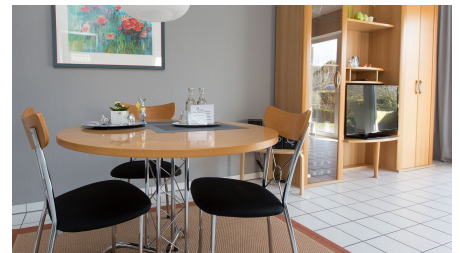
Ferienwohnungen Markus | Bad Lippspringe