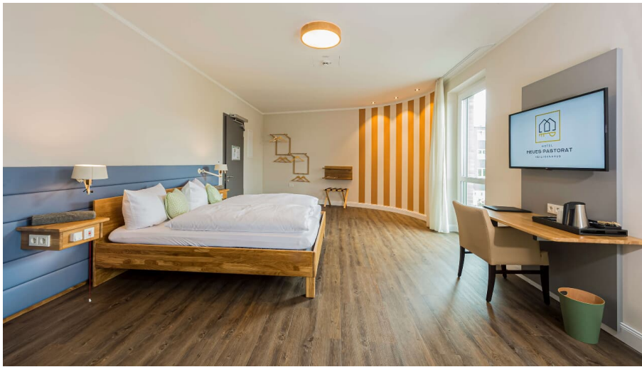
Hotel Neues Pastorat in Heiligenhaus