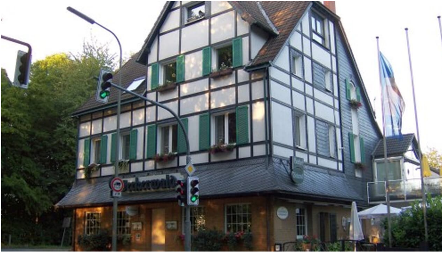
Gästewohnung Werkerwald in Heiligenhaus