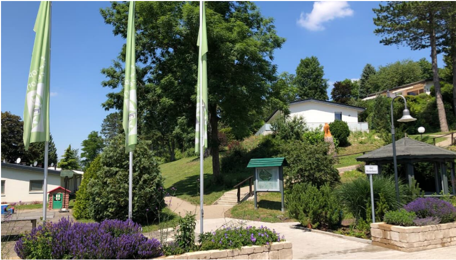
Europa Feriendorf | Lichtenau-Husen