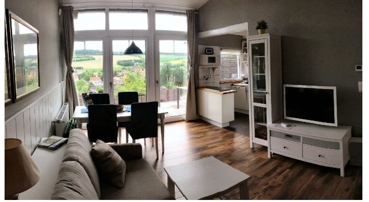
Europa Feriendorf | Wohnzimmer mit Blick ins Grüne