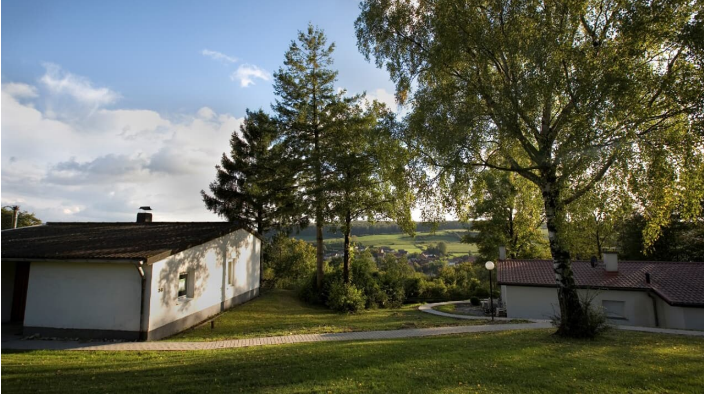
Europa Feriendorf | Blick ins Altenautal