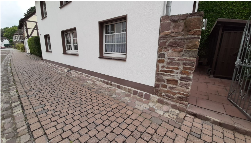
Eingang.jpg - © Ferienwohnung an der Stadtmauer