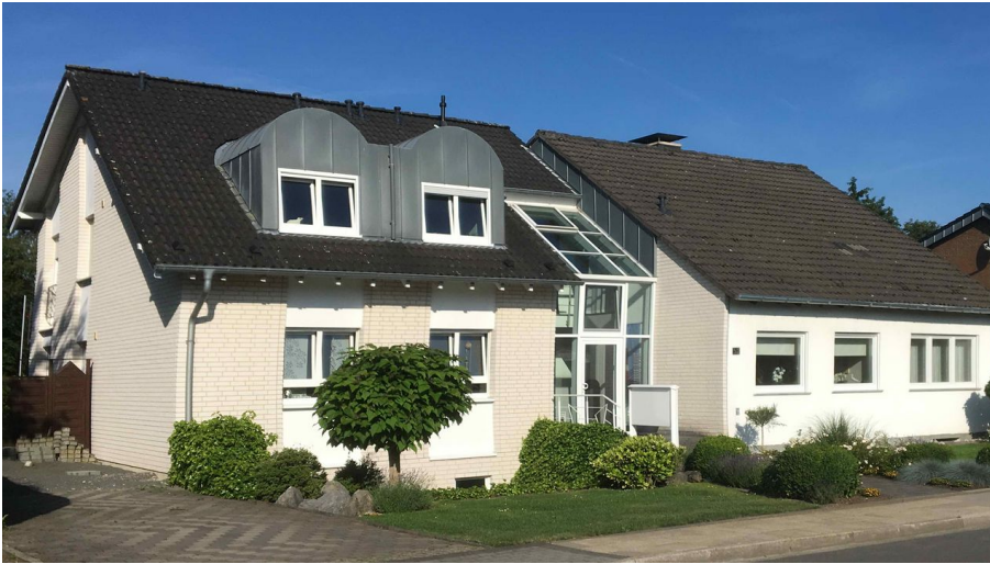
Ferienwohnung Lipinski in Velbert