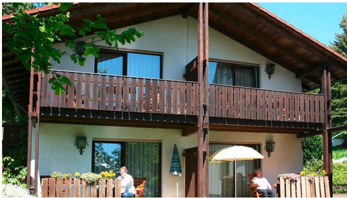
Außenansicht Gästehaus