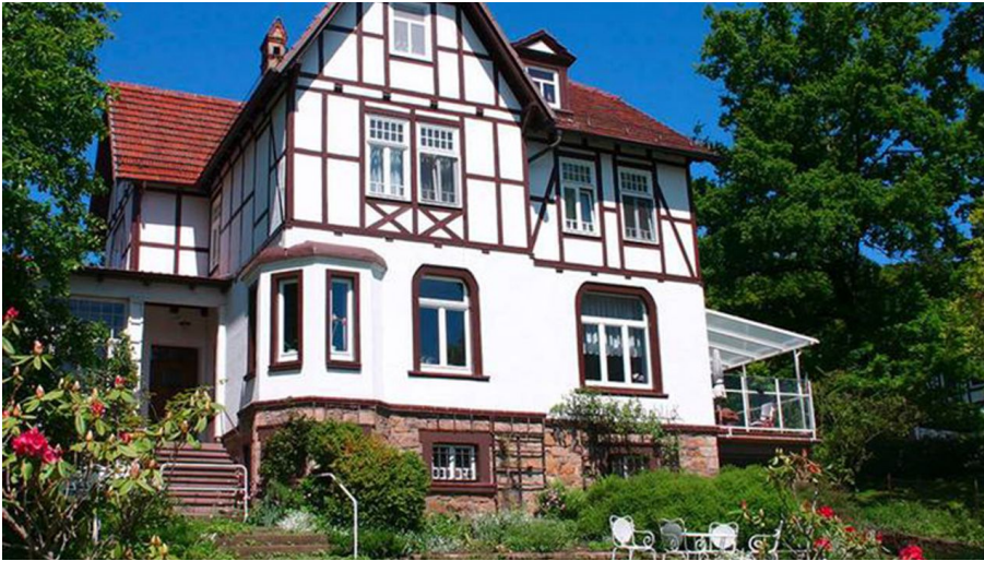
Außenansicht Haupthaus