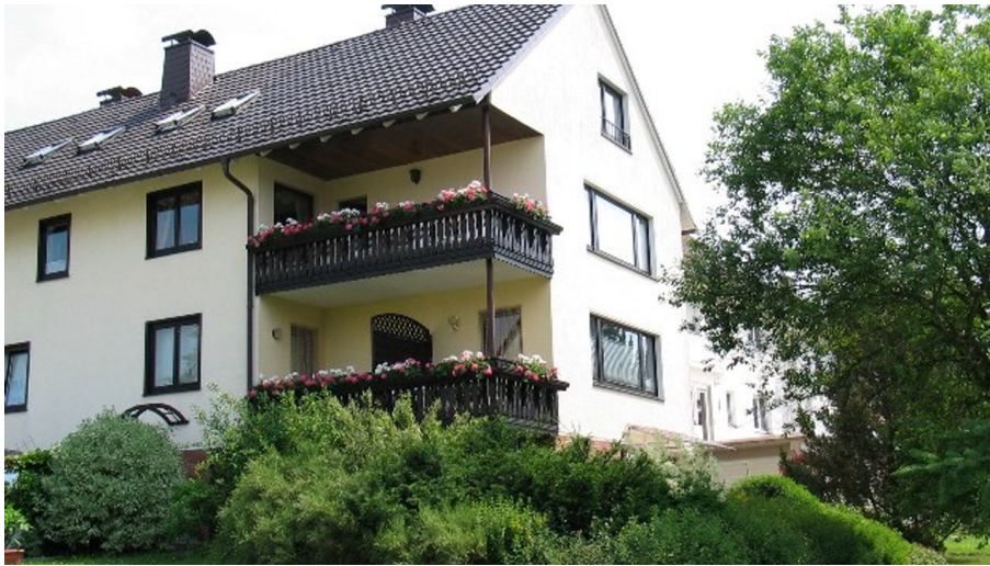
Haus Gillich Außenansicht - © Ingrid Gillich