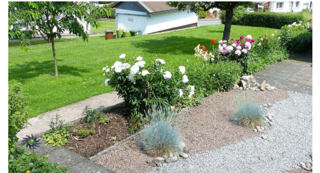
Garten - © Verena Steinbrecher