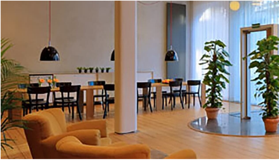
Gästehaus Rohleder in Velbert - © Soenne Aachen