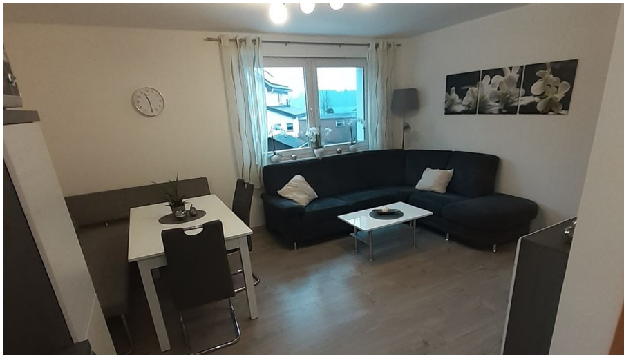
Ferienwohnung Fockel in Schloß Holte-Stukenbrock