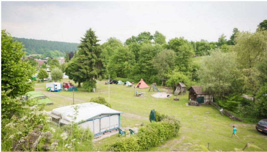
Campingplatz Eggewald in Horn-Bad Meinberg