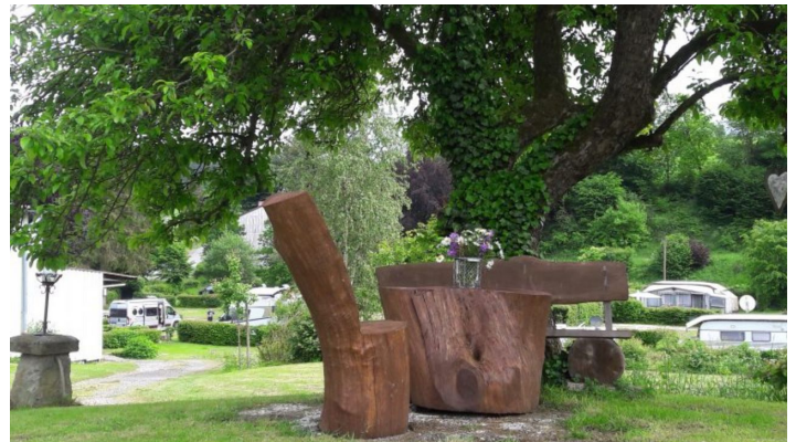
Campingplatz Eggewald