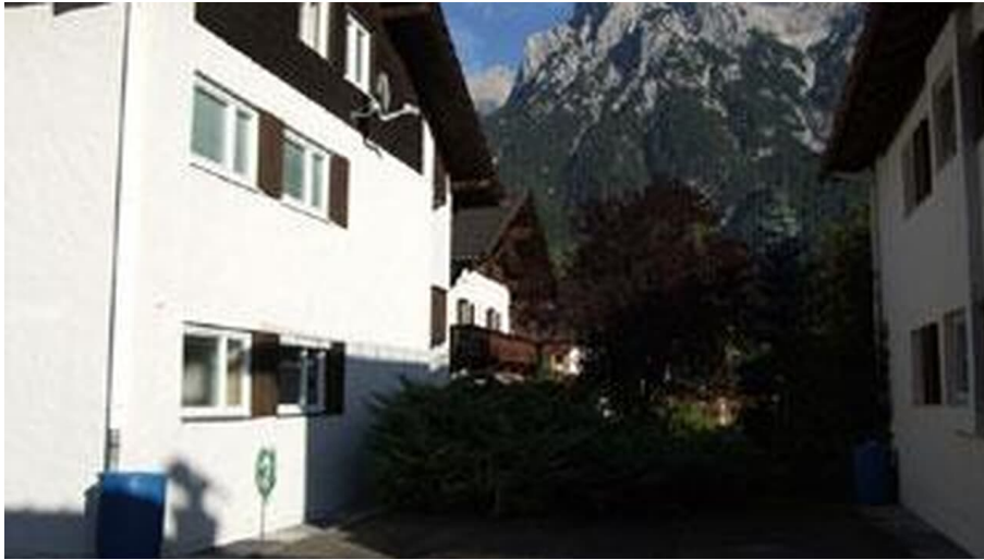
Hausbild im Sommer