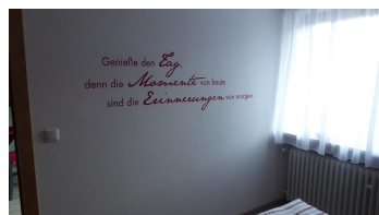
Leitmotto Ihres Urlaubs