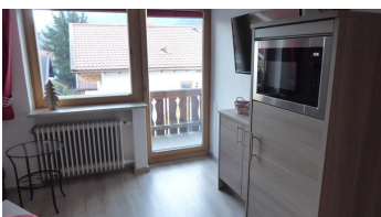
Zutritt zum Balkon