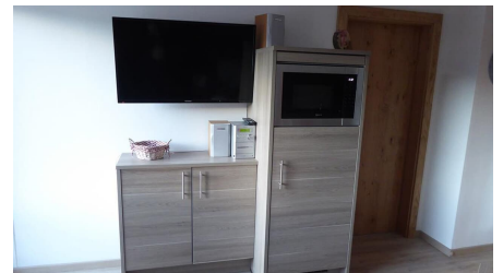
Kühlschrank, Mikrowelle, TV