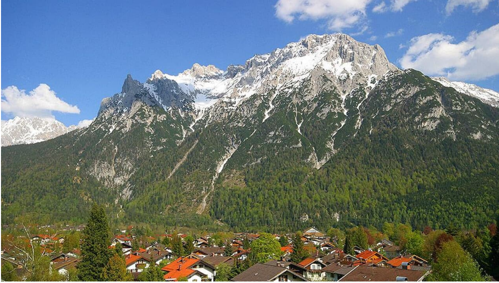
Blick zum Karwendel