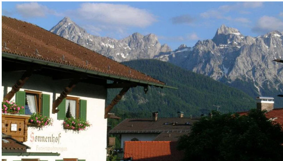
Hausansicht Westseite mit Karwendel