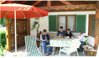
Terrasse für unsere Gäste