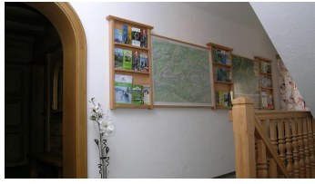
Informationstafel im Hausgang