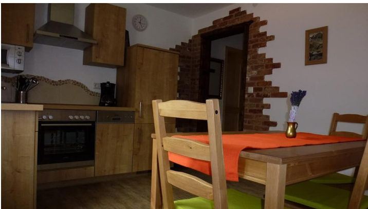
Küche Appartement "Karwendelblick"