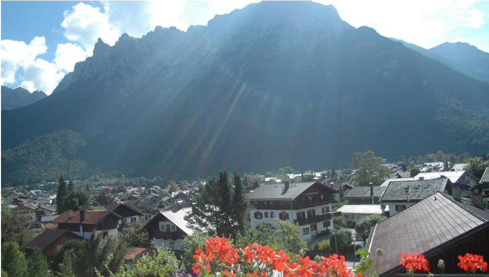
Ausblick vom Balkon