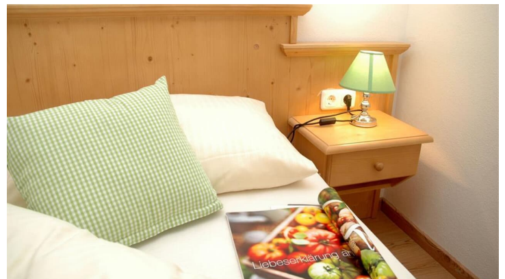
Fewo Schöne Aussicht