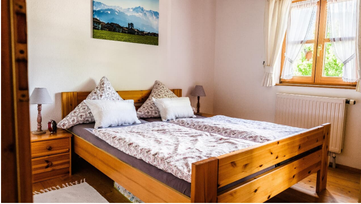
Haus Elender - Schlafzimmer