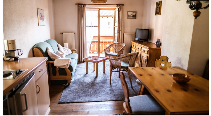
Haus Elender - Wohnraum