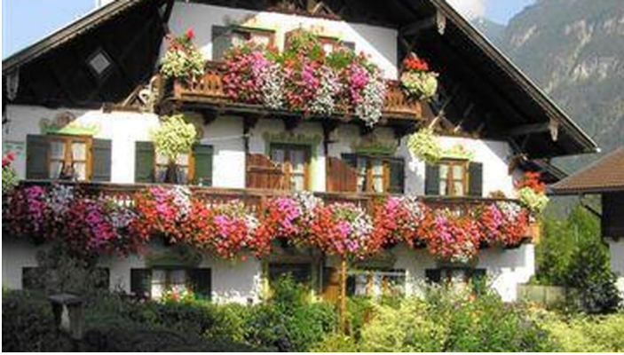
Haus und Garten