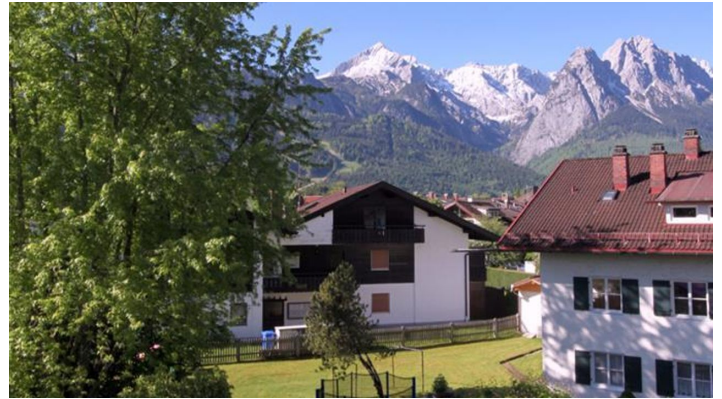
Blick aufs Bergpanorama