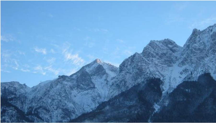
Blick im Winter