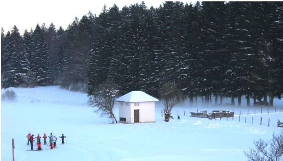
Blick im Winter