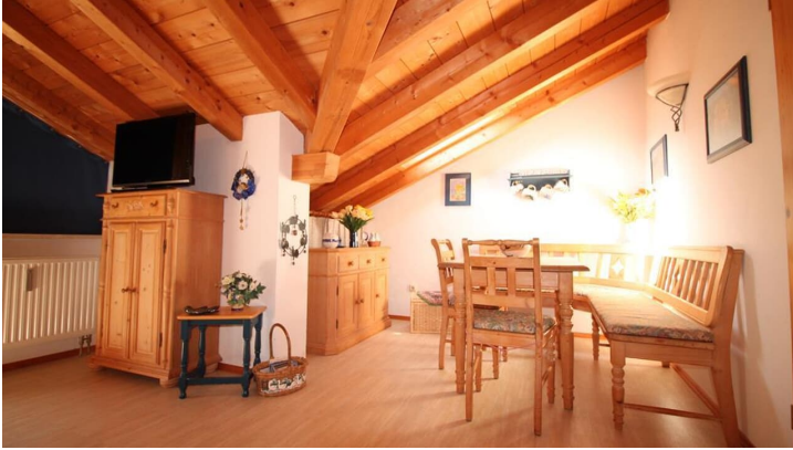
Essbereich im Wohnzimmer