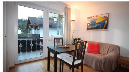
Wohn/Schlafzimmer mit Essplatz