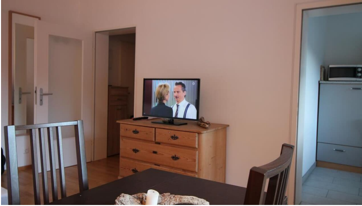
Essplatz mit Blick zu Diele /Küche