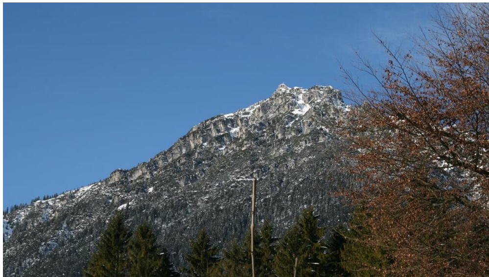
Blick auf den Kramer