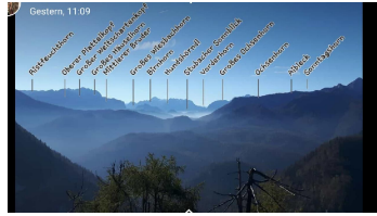
20190105_103207 - © Unsere Alpen und Berge Namentlich genannt