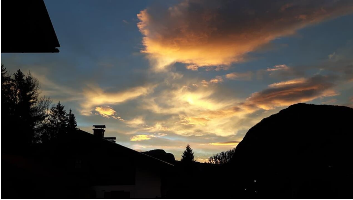
20161122_072307 - © Morgenrot im November