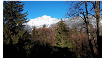
20181218_101140 - © Hochstaufen schneebedeckten und der Fuderheuberg