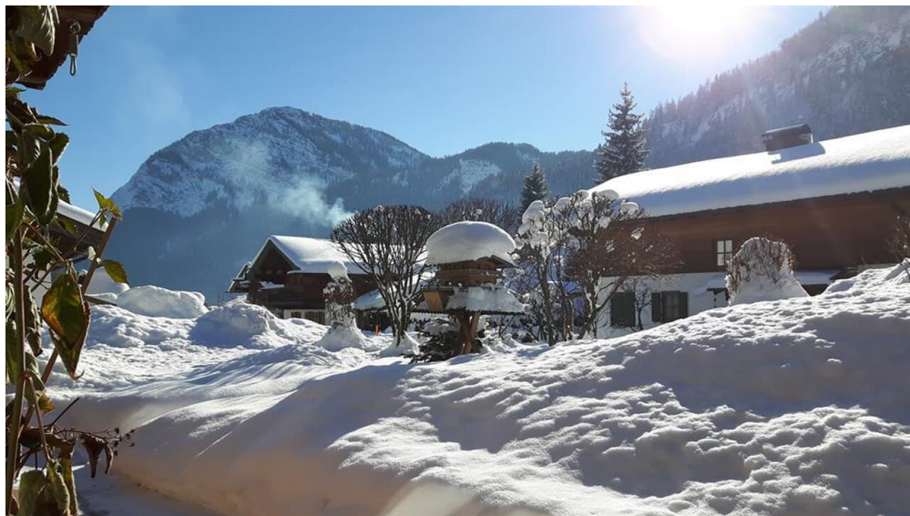
20170122_123132 - © Winterstimmung mit Traumwetter