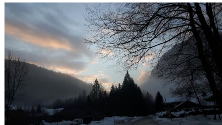
20170203_074144 - © Abendrot mit winterlicher Umgebung