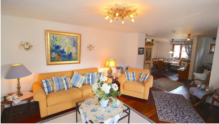
Chalet Rose