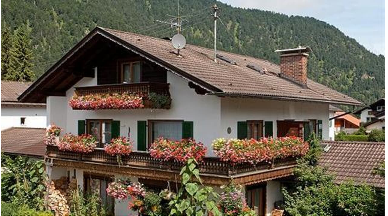
Haus Mangold 2