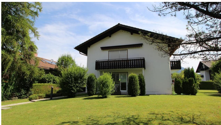
BERGLUST Haus