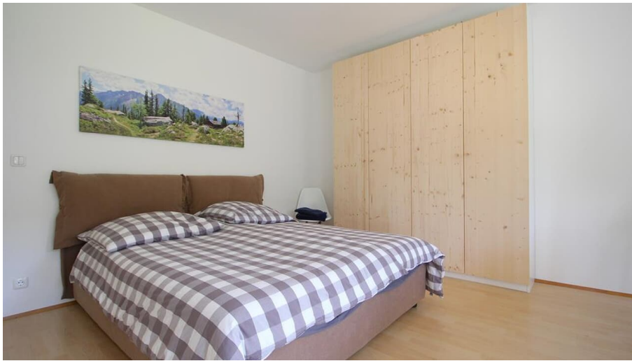
BERGLUST SZ