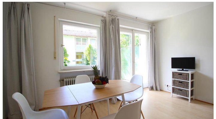
BERGLUST Essbereich