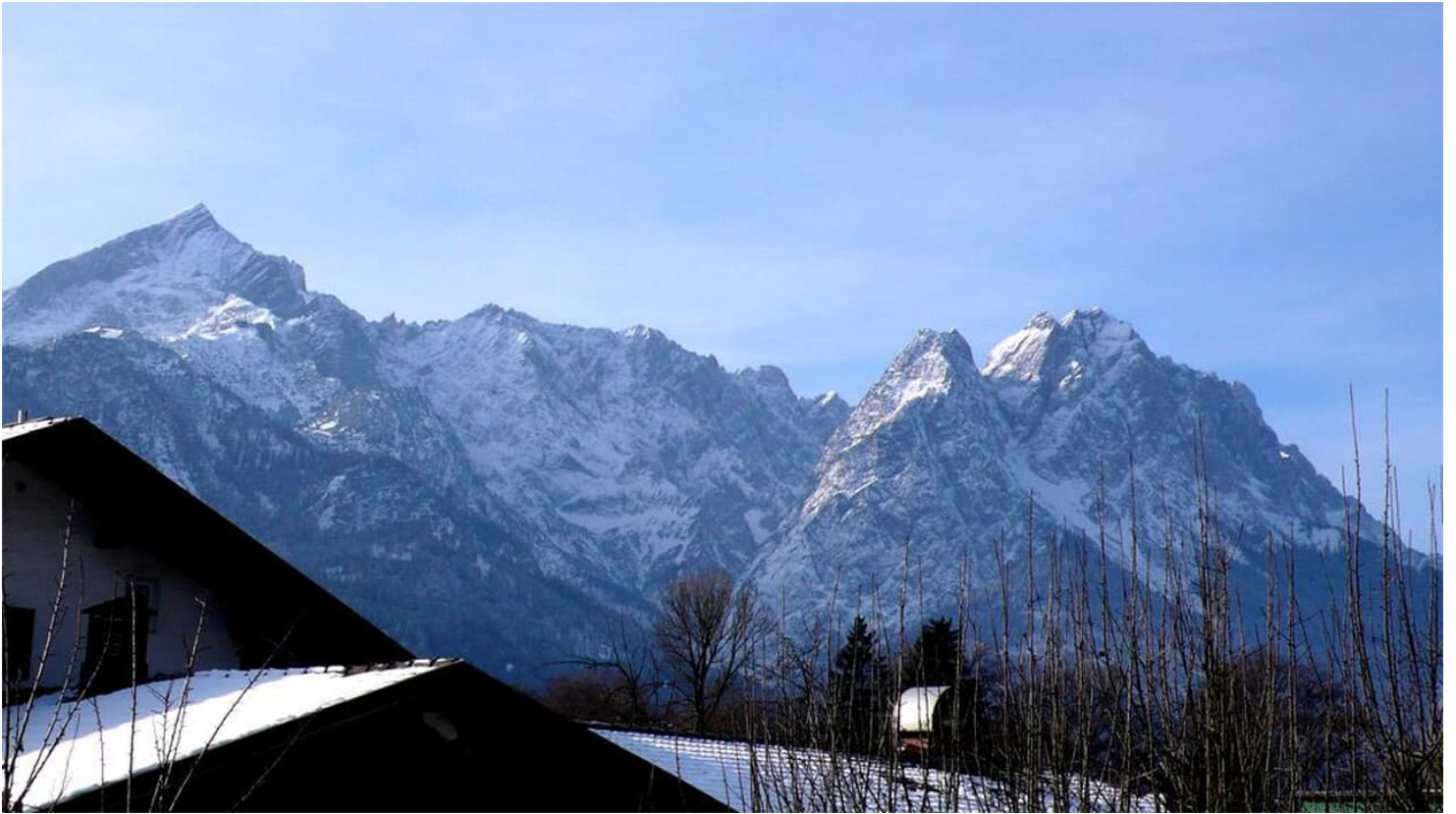
Winteraussicht von Ihren Balkonen