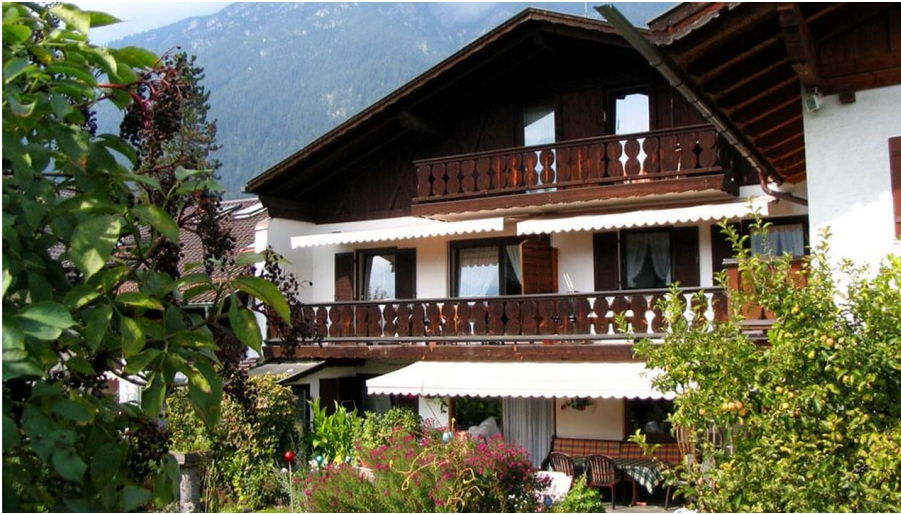
Herzlich Willkommen bei Familie Ostler !