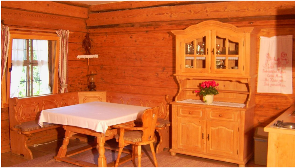
Kopie (2) von PIC_0977