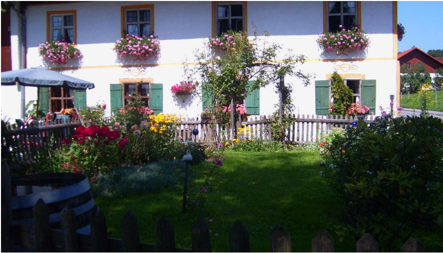
Kopie von PIC_1001