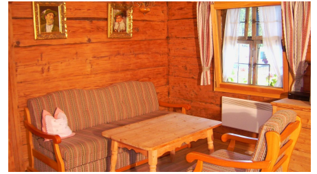
Kopie (2) von PIC_0980 - © Marion Heßler