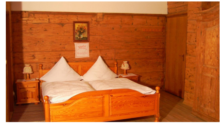
Kopie (2) von PIC_0984