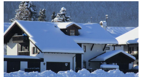
Hausansicht im Winter