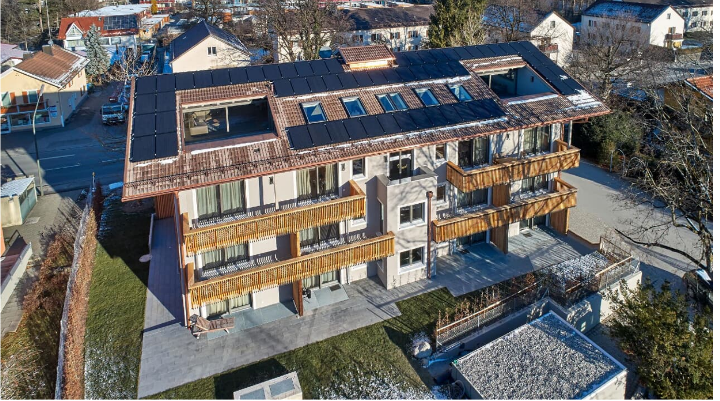
Aussenansicht von oben