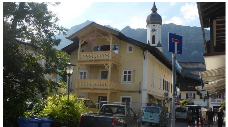
Zufahrt zum Parkplatz