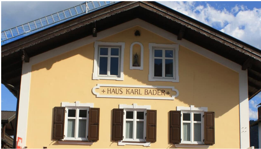
hier liegen die Wohnungen im 1. und 2. Stock