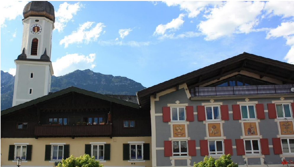
Blick aus dem Wohnzimmer 1.Stock