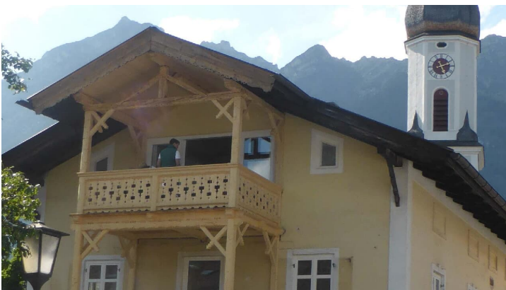
neue Balkonanlage Wohnung 1. und 2. OG