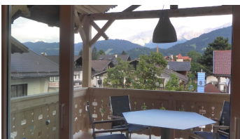
Balkon Wohnung 2.Stock