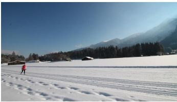
Loipe vor dem Haus