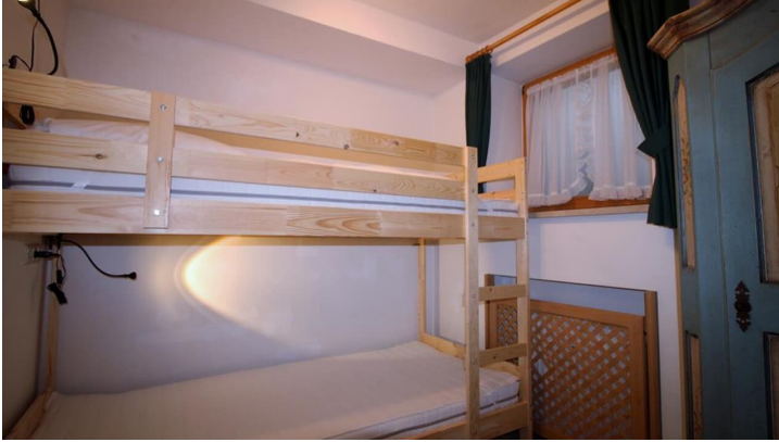
Stockbett im kleinen Schlafzimmer