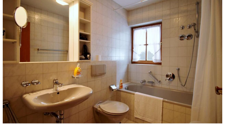
Badezimmer im EG