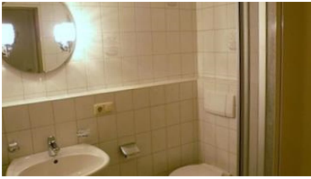
Badezimmer im UG