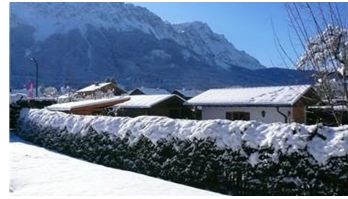
Blick im Winter