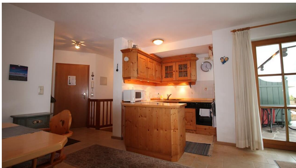
Wohnraum mit Küche