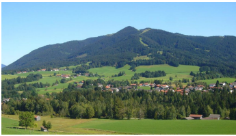
Hörnle Bad Kohlgrub