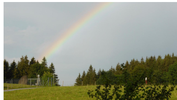
Aussicht Sonnenhof FEWO Küche