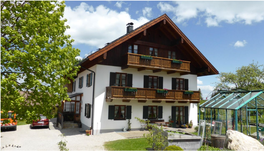
Sonnenhof Bad Kohlgrub Blumen und weiße Wolke