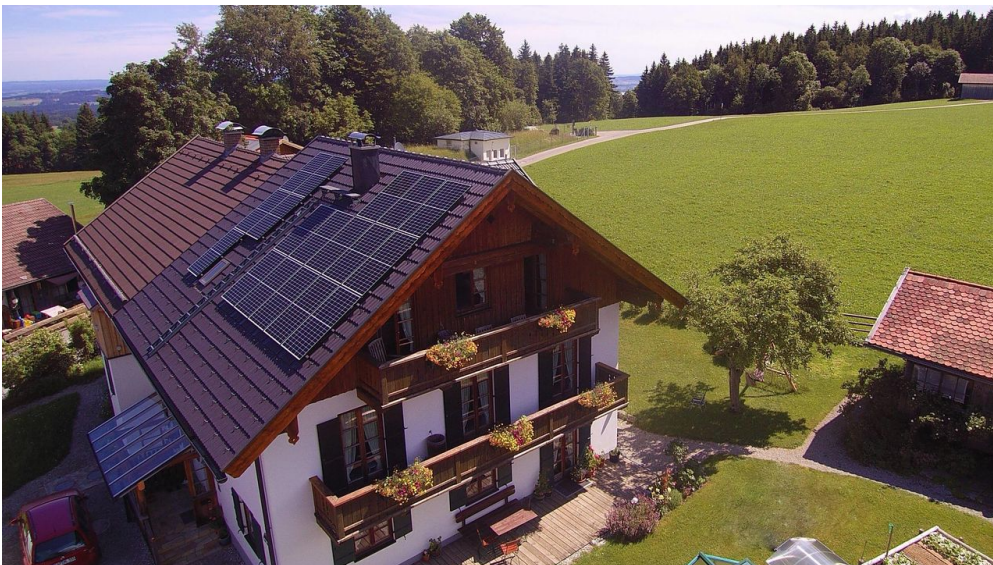
Sonnenhof Bad Kohlgrub