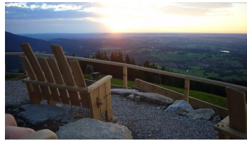
Abendstimmung am Hörnle - Zeitberg Bad Kohlgrub