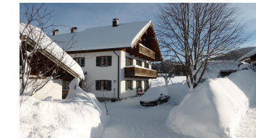
Sonnenhof Bad Kohlgrub Einfahrt Winter 2019