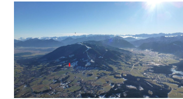
Hörnle und Ammertal mit Sonnenhof Standort - © Thomas Lang Bad Kohlgrub