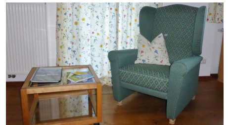
Ferienwohnung Sonnenhof angenehm wohnen