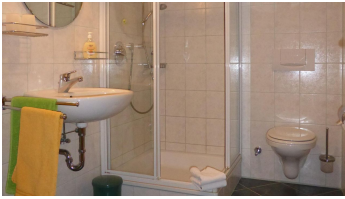
Sonnenhof Bad Kohlgrub Bad FEWO - © Thomas Lang Bad Kohlgrub