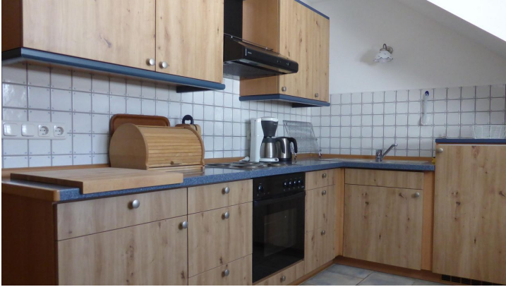
Küche FEWO Sonnenhof