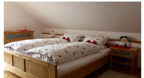
Sonnenhof Bad Kohlgrub Schlafzimmer