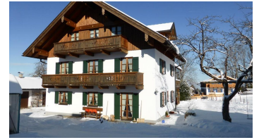
Sonnenhof Bad Kohlgrub Winter