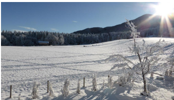
Sonnenhof Bad Kohlgrub Winter Aussicht