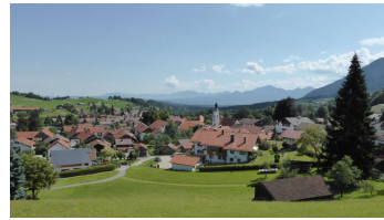
Bad Kohlgrub Sommer