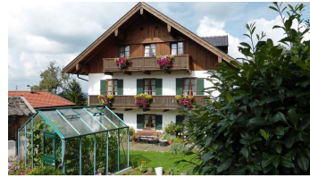
Sonnenhof Süd mit weißen Wolken