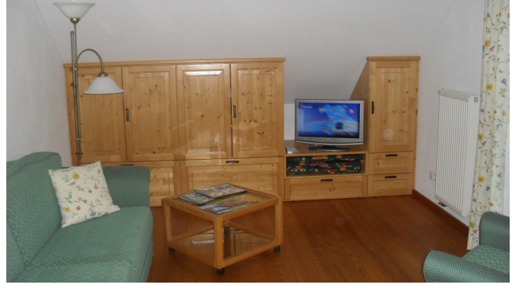
Sonnenhof Bad Kohlgrub FEWO Wohnzimmer - © Thomas Lang Bad Kohlgrub