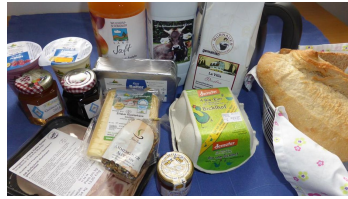
Ammergau-Alpenfrühstück Sonnenhof Bad Kohlgrub