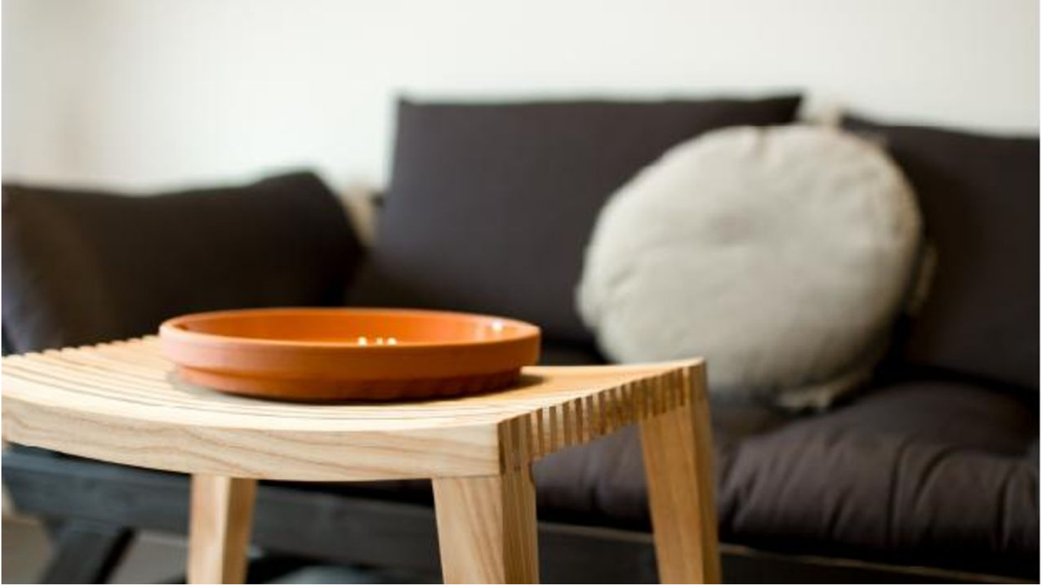
Studio-Lilji_Ferien-Apartment GAP (3)