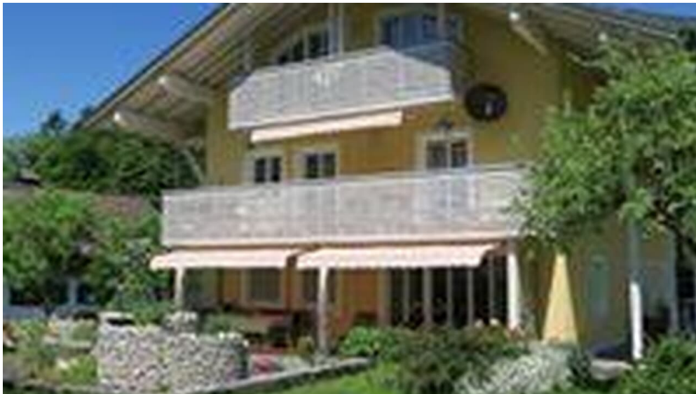
Haus Regina Häusl-Leins