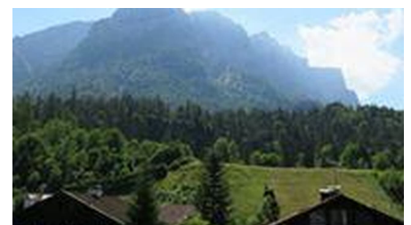
Ausblick in die Bergwelt