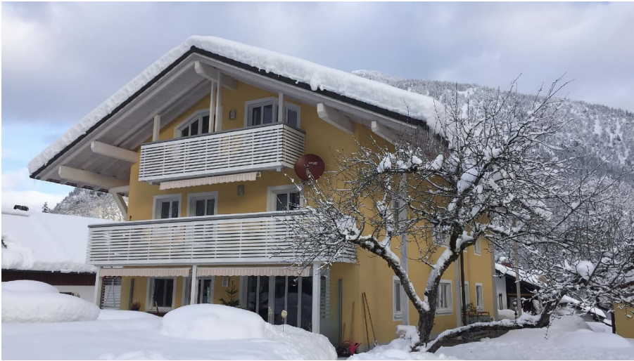
Bei uns im Winter