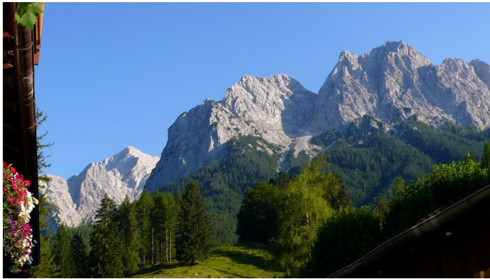
Aussicht auf das Bergpanorama