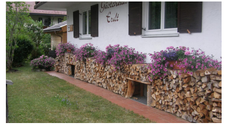
Wenn 's kalt wird - © ME Gästehaus ERDT