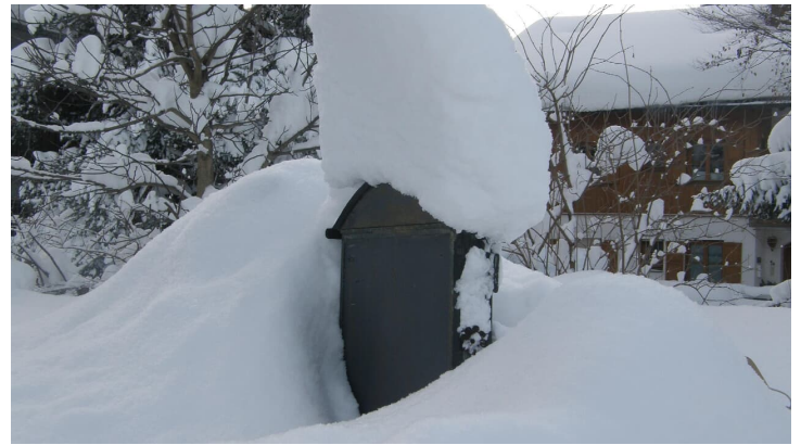
Warten auf Gäste