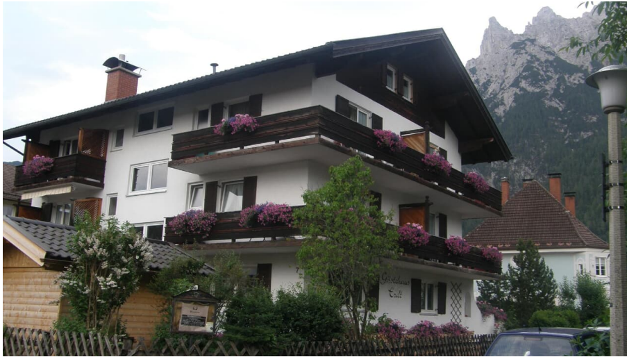
Blick von SW-Einfahrt