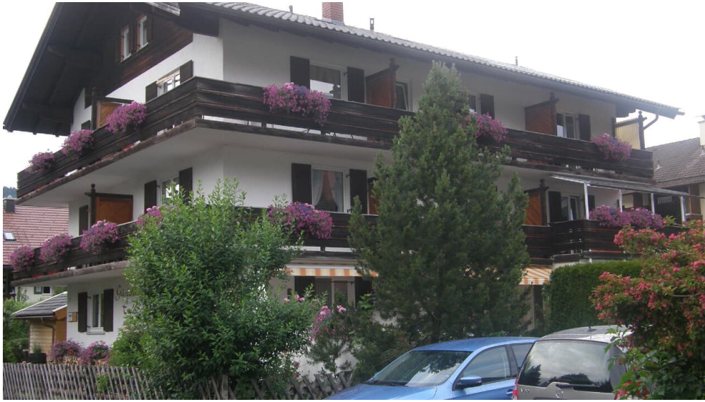
Blick von Süden