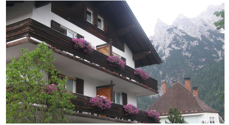
Blick zum Karwendel