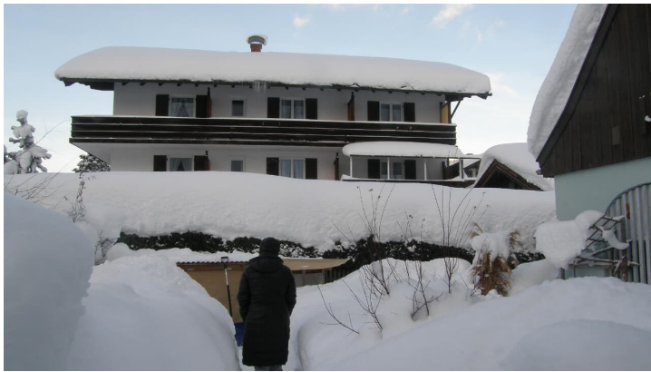
Winter is so